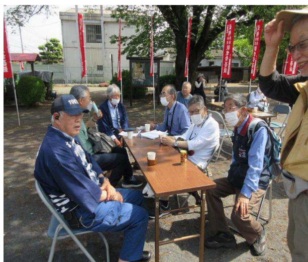
木曾の地元識者と懇談 7月9日