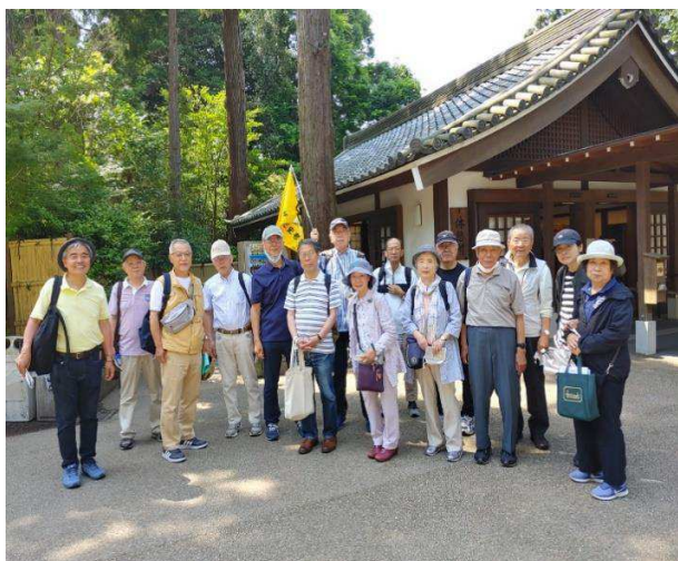
北鎌倉 円覚寺 6月8日