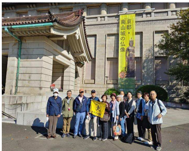
東京国立博物館 11月18日